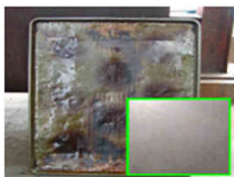
パン焼きプレート